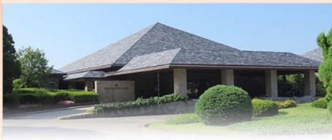
伝統と格式に満ちた、誇り高きステージ 人と地球にやさしい、次世代のゴルフ場を目指して